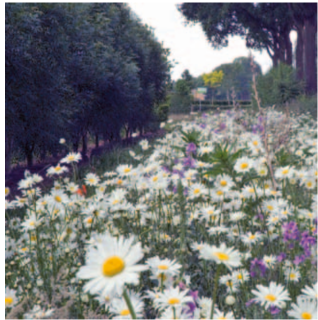
Bloemenmengsels als bestrijdingsmiddel.

Nederland, hard gemaakt om de herziening terug te draaien. Gelukkig is onze wens gehonoreerd.”