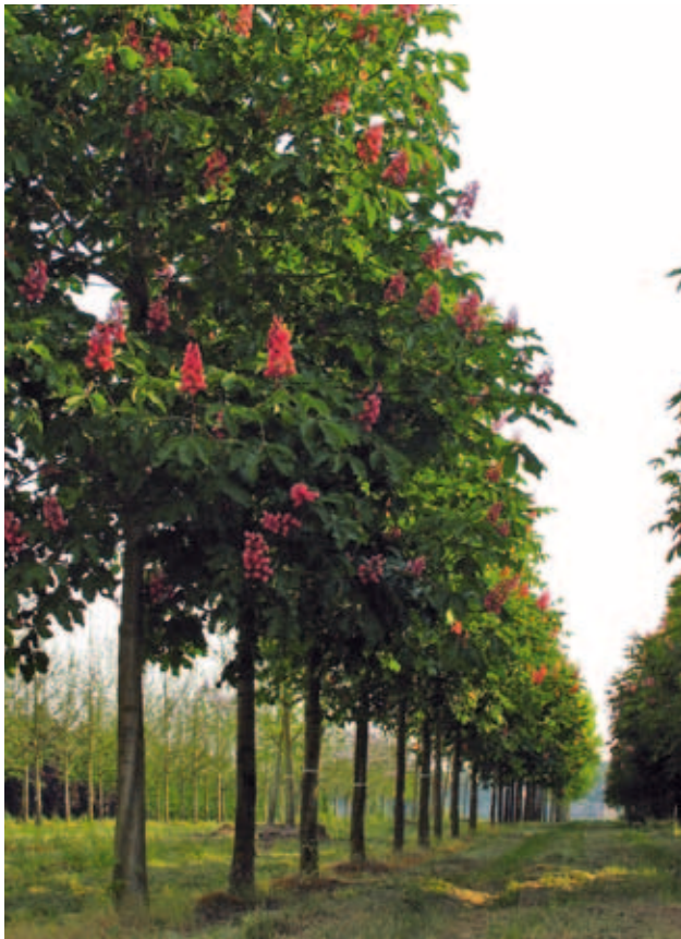
Bloeiende kastanjes in grasbanen op de kwekerij van Ebben.