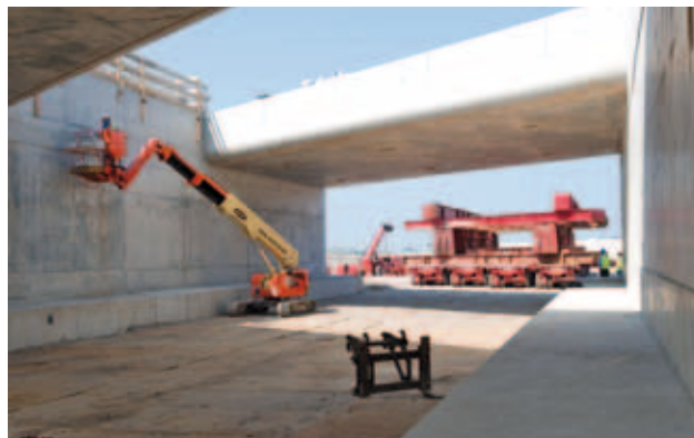
Bouw viaduct Leidsche Rijn.